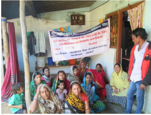
(स्व: सहायता समुह )

विकासात्मक संदेश, जैसे बाल अधिकार व सुरक्षा की जानकारी कोचिंग क्लास आदि द्वारा दी गई। इस कार्यक्रम को सफल बनाने में सीएलए के सदस्यों की भूमिका रही।