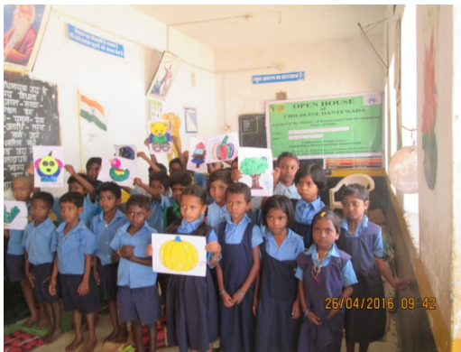
(विकासात्मक खेल गतिविधि )