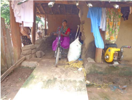
हैण्डिकैप इंटरनेशनल परियोजना :-

गया। सुकमा विकास खण्ड के कुल 12 गांवों में सर्वे कार्य किया गया।